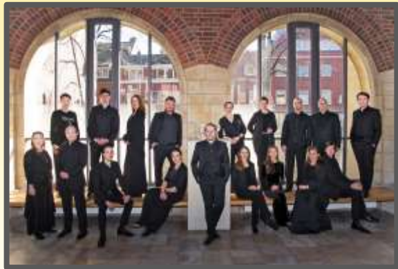
Seicento Vocale, © Stephan Summers