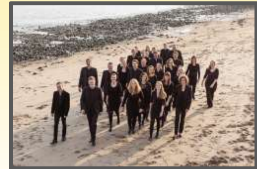
hamburgVOKAL, ® Dennis Williamson

*Stiftsmusik-Stipendiaten 2020 bis 2022 (Stipendium für Vokalensembles)