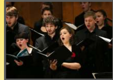
Madrigalchor der Hochschule für Musik und Theater München

Einige Gastchöre und –ensembles in der Stunde der Kirchenmusik 2022: